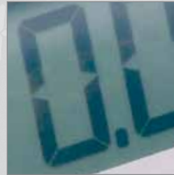
14-Segment-LCD- Gewichts- und Textanzeige