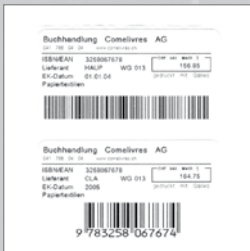
10 frei gestaltbare Wägeabläufe und Druckbilder