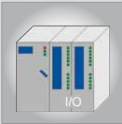
Schalten und Steuern Ein- und Ausgänge