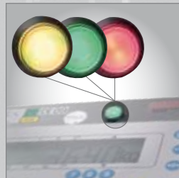
Optischer Signalgeber* • 3-farbig (gelb, grün, rot) zur einfachen Soll-Ist-Kontrolle oder zur Anzeige des Waagenzustands (Tara, Nulllage, Ruhelage)