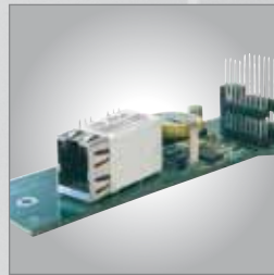
Optionskarten • Ethernet • Profibus • Analogausgang • Alibispeicher