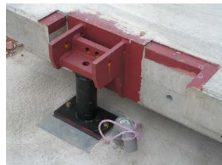
Anbringen der Wägezellendummies zur Aufnahme der Brückenmodule