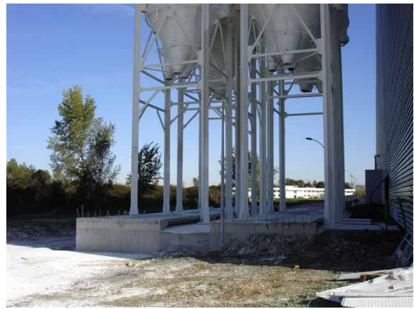
Einbau unter Silos